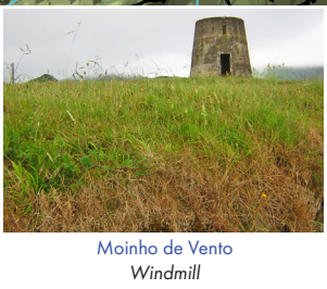
Moinho de Vento Windmill