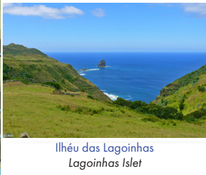
Ilhéu das Lagoinhas Lagoinhas Islet