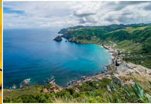
Miradouro dos Alagares Alagares Viewpoint