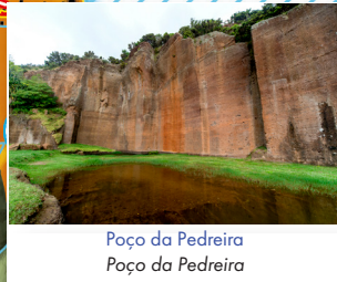
Poço da Pedreira Poço da Pedreira